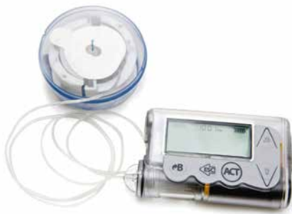
Insulinpumpe mit Infusionsset

Darüber hinaus liefern wir Lösungen für Ihre anspruchsvollen Messtechniken und low-size-Steuerelektroniken, die wir in unserem hauseigenen EMV-Labor entwicklungs- begleitend prüfen. Im Fokus steht immer der medizinische Patientennutzen, die Benutzer- freundlichkeit und die Wirtschaftlichkeit.